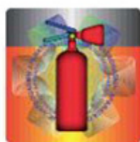
Slika 5. Izgled holograma u prirodnoj veličini